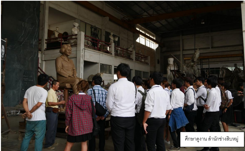
ศึกษาดูงาน สำนักช่างสิบหมู่