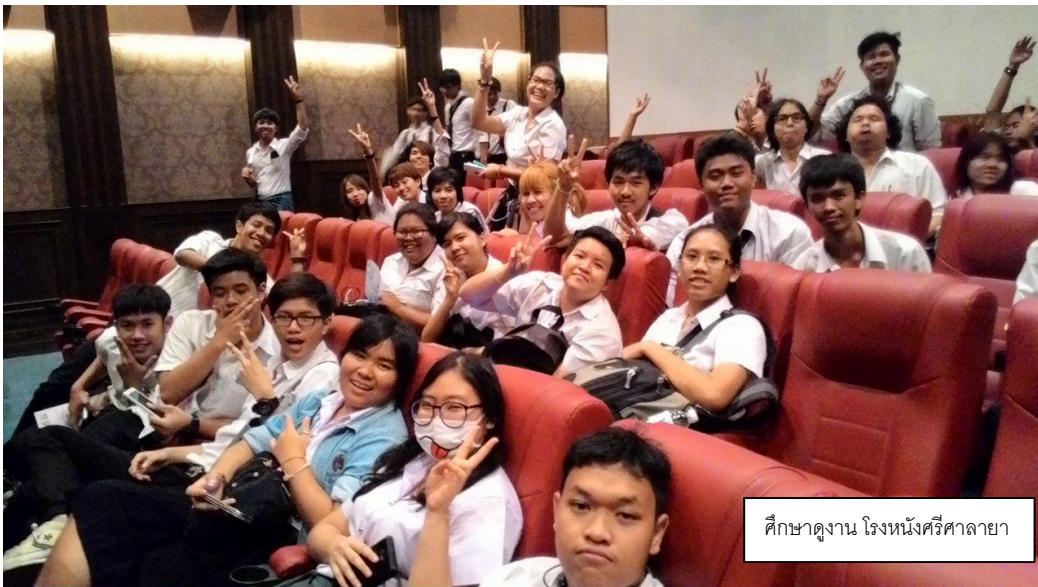
ศึกษาดูงาน โรงหนังศรีศาลายา